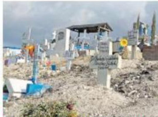
Desde que inició la pandemia no se había tenido un registro tan alto de fallecidos por el Covid-19. En enero de este año, han muerto 53 personas por día / Ver más

El mes de enero fue el más mortal desde que llegó la pandemia del Covid-19 a Baja California en marzo del 2020 con el registro de mil 223 decesos y diez mil 33 casos positivos. Lo dice que 82.5% de las víctimas mortales que se ha llevado la pandemia marplatense en este mes, según estadísticas de la Secretaría de Salud. Cuando el Intermunicipal de Información y Atención al Ciudadano dijo que son más mil 734 los fallecimientos que se han registrado. Ver más