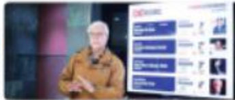
BAJA CALIFORNIA.- Bajó el nivel de confianza en los más altos niveles con respecto al presidente de México, Andrés Manuel López Obrador.